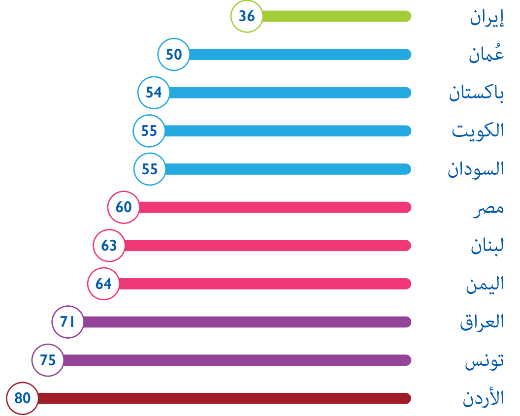
الشكل 1: الترتيب العام لتدخلات دوائر صناعة التبغ