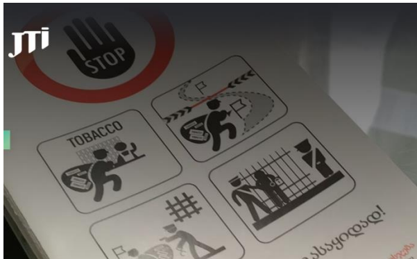
Picture shows the training material designed by JI for the Georgian Revenue Service officers.

თამბაქოს ინდუსტრია მხარს უჭერს ფინანსთა სამინისტროს შემოსავლების სამსახურს და ტრენინგებს უტარებს მათ პერსონალს, ასევე საბაჟო სამსახურს უზრუნველყოფს ძალებითა და დროებით კონტრაბანდის აღმოჩენის მიზნით. JTI-მ განაცხადა, რომ მან წარმატებით ჩაატარა კონტრაბანდის საწინააღმდეგო სემინარების სერია საქართველოს სახელმწიფო საბაჟო დეპარტამენტისთვის და დააფინანსა ბიზნეს-ადმინისტრირების სტუდენტები რამდენიმე უნივერსიტეტში. 117